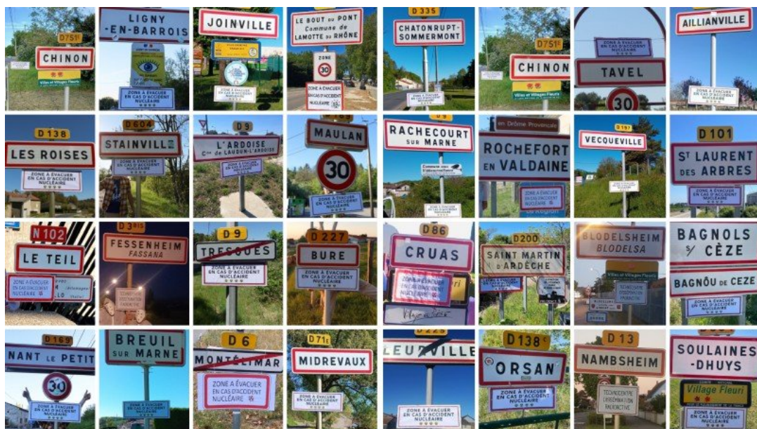
Zones à évacuer en cas d'accident nucléaire

L'objectif est de passer de 60 % d'énergies fossiles dans la consommation à 60% d'énergie dite décarbonée d'ici 2030, et 70 % en 2035.